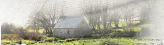
Manoir de Rozonoual, Commana (29) - LCB

L'exportation vers l'Angleterre, l'Espagne et le Portugal ouvre à la Bretagne l'immense marché américain. Sa conquête se fait alors avec des voiles de chanvre et des marins habillés de chemises de lin bretonnes !